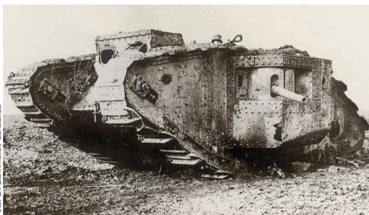
Ein (erbeuteter) britischer Tank, Sinnbild für die Überlegenheit der Westalliierten und den militärischen Zusammenbruch Deutschlands und Österreich-Ungarns im Ersten Weltkrieg (1914–18)