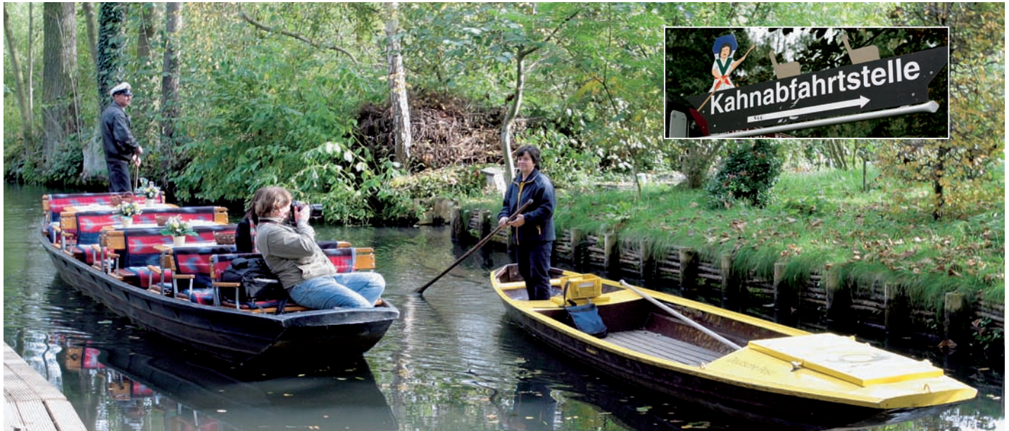
Das Postboot im Spreewald. Ein beliebtes Motiv für Fotografen

Gruppenreisen sind langweilig! Alle Termine sind vorgeschrieben und man muss immer schön bei der Truppe bleiben. Fängt mor- gens schon an: 8 Uhr Frühstück, dann 12 Uhr Mittagstisch und um 18 Uhr