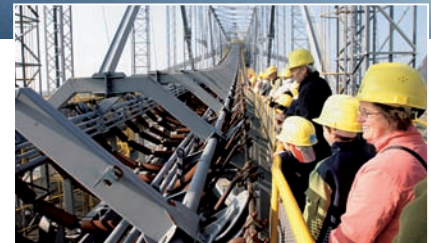
Die Abräumförderbrücke F60 ist 180 Meter länger als der Eiffelturm hoch ist