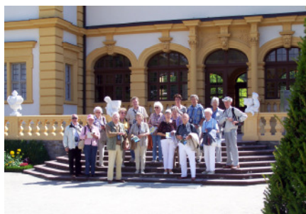
Zu Gast auf Schloss Veitshöchheim

Nach einer Zwischenmahlzeit ging es mit dem Schiff zurück nach Würzburg zu einer Stadtführung.