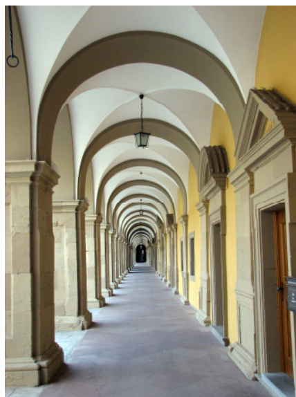
Juliusspital in Würzburg

Sonntag. In der Kirchengemeinde wartete eine Liveübertragung eines Gottesdienstes aus Pforzheim auf die Besucher. Die Leitung dieses per Satellit europaweit ausgestrahlten Gottesdienstes für die Entschlafenen hatte Bezirksapostel Michael Ehrich inne. Umrahmt wurde der Gottesdienst mit Beiträgen von Jugendchor, Posaunenchor sowie eines zu dieser Zeit auf Tournee befindlichen neapostolischen Chores aus Südafrika.