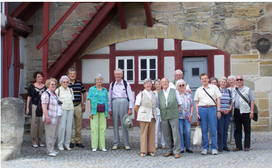
Die Reisegruppe in Iphofen

Sommerliche Leserreise vom 2. bis 7. Juli 2008