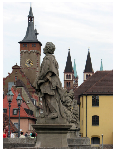
Alte Mainbrücke mit Blick auf Würzburg

Beim letzten gemeinsamen Abendessen ließen die Reisetilnehmer ihre rundum positiven Eindrücke Revue passieren, und zeigten sich einig im Vorsatz, im Bekanntenkreis für die Bischoff-Leserreisen zu werben.